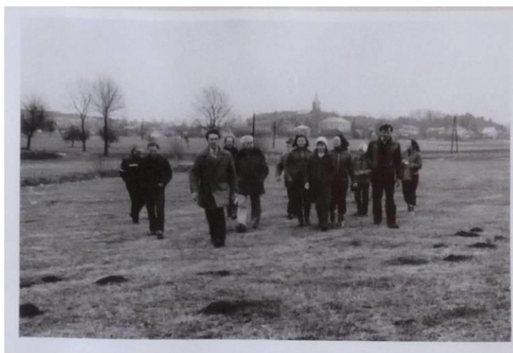
Zpěváci jubilejní 30. štěpánské koledy roku 1983

Za uplynulých více než 50 let museli čelit koledníci různým rozmarům počasí, obvykle však v podhůří Krkonoš bylo dostatek sněhu, do něhož se na fotografii boří účastníci koledy v roce 1975.