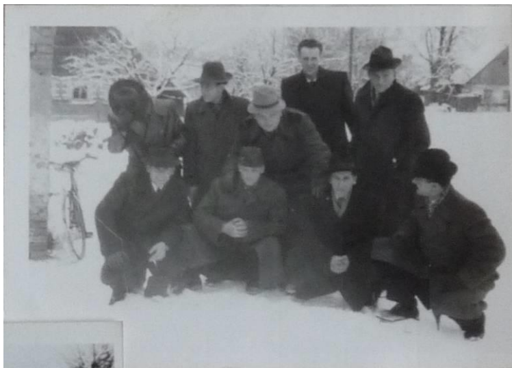
Skupinová fotografie jedné z prvních skupin koledníků z roku 1956.