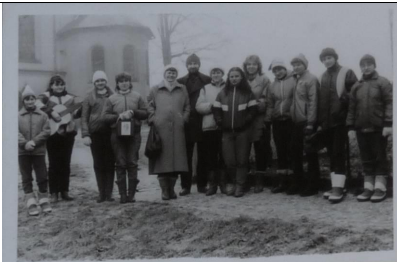
Snímek skupiny kolednic z roku 1987.