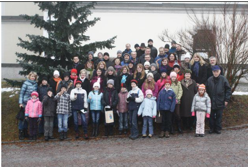
Průběh obchůzky (2011): skupinové fotografování koledníků před kostelem ve Studenci.