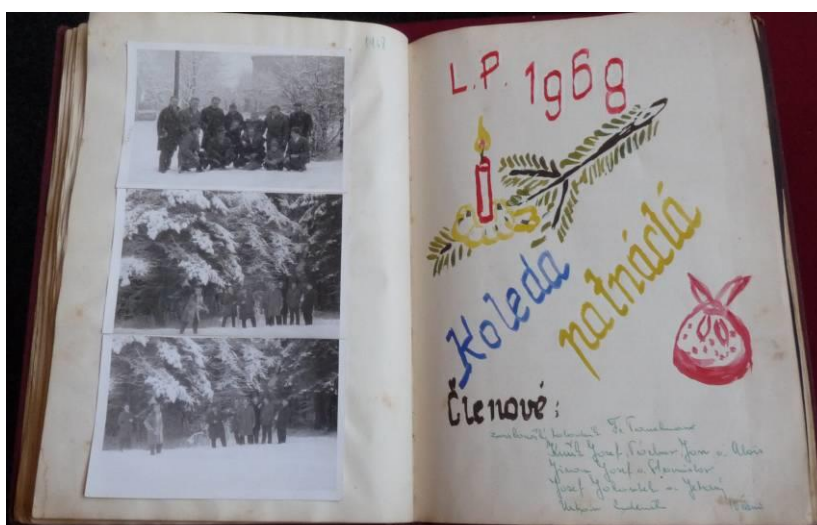
Ukázka z 1. dílu kroniky dokumentující státek v letech 1954-1988.

Příloha č. 3 – mapa, do níž je zakresleno místo či oblast, kde se státek vyskytuje.