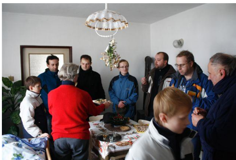
Průběh obchůzky (2011): pohoštění tradičními jednohubkami u paní zubařky.