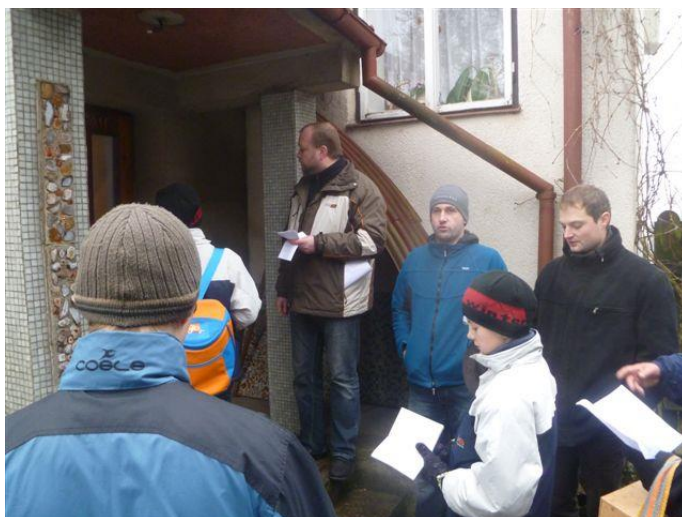
Průběh obchůzky (2011): zastávka na trase mužské skupiny koledníků.