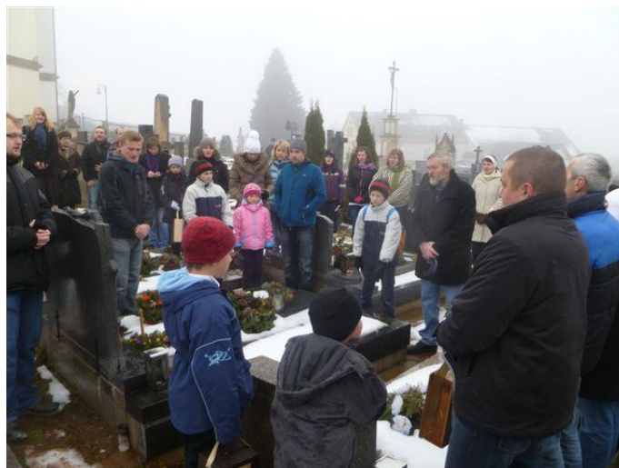
Průběh obchůzky (2011): před vykročením na samotnou obchůzku uctí koledníci památku svých bývalých druhů.