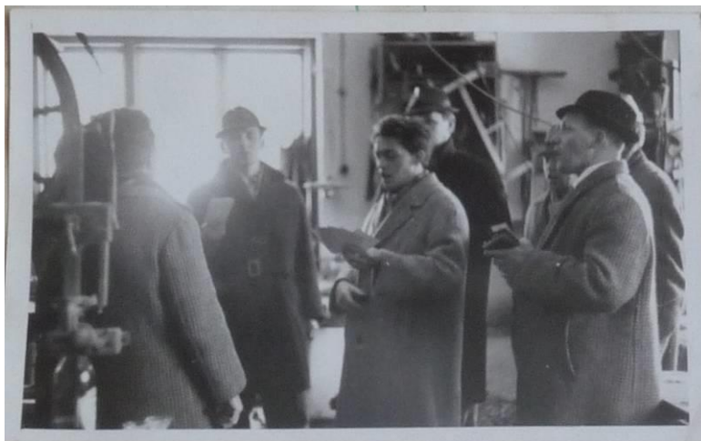
Z koledy v roce 1966 pochází snímek „koladníků“ zpívajících v dílně u Makovičků.