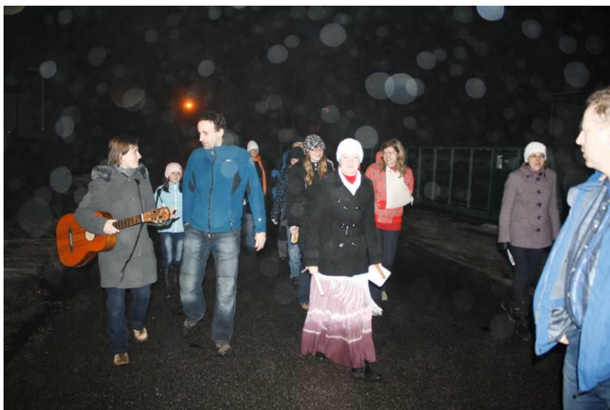
Průběh obchůzky (2011): závěrečné setkání koledníků a kolednic.