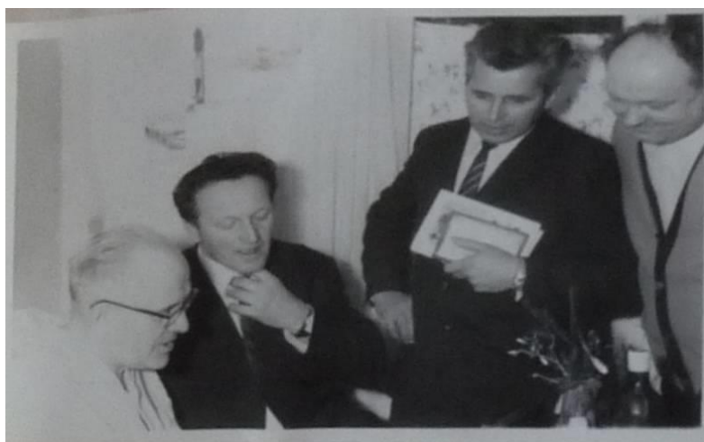
Návštěva koledníků v domově seniorů v Rokytnici nad Jizerou v roce 1971.