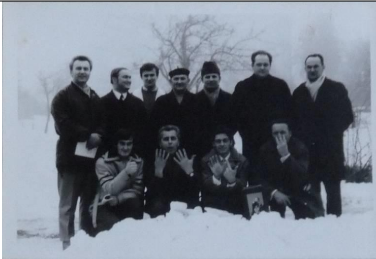
Skupinová fotografie koledníků z roku 1973.