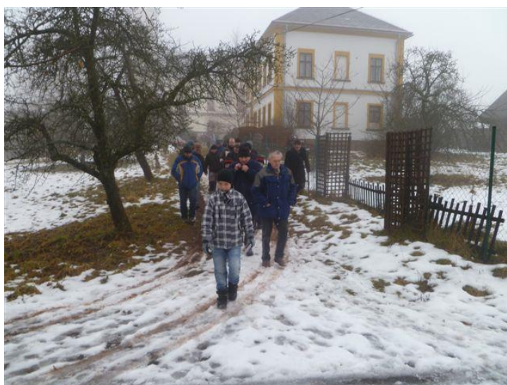
Průběh obchůzky (2011): mužská část koledníků se vydává na cestu po Studenci.