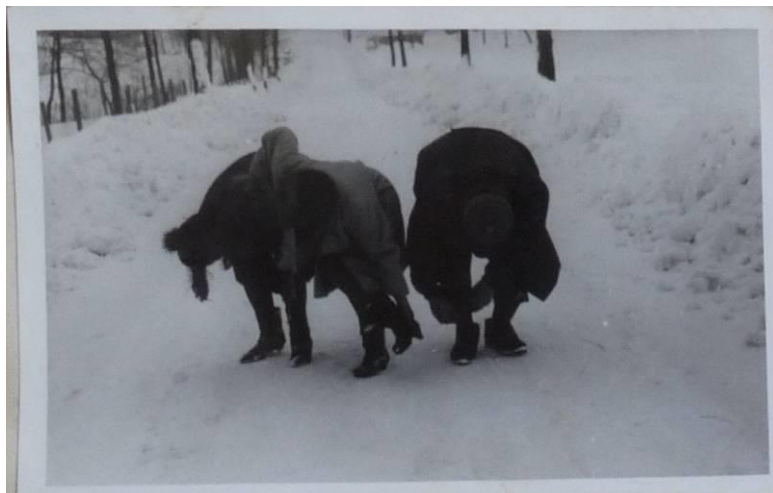
Kronika štěpánské koledy zachycuje také humorné momentky, které s sebou občůzka přináší, v tomto případě vyklepávání sněhu z obuvi v roce 1966.