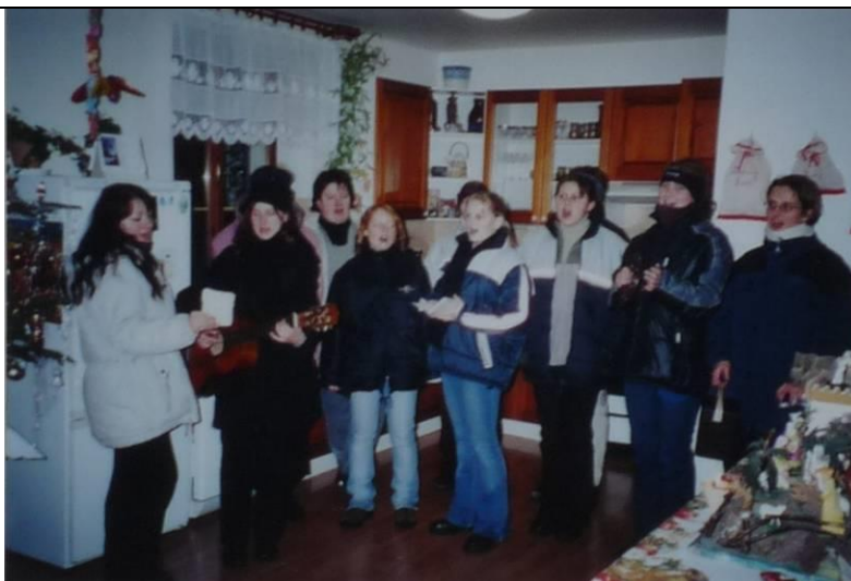
Kolednice zpívající za doprovodu kytary v jedné z domácností v roce 2002.