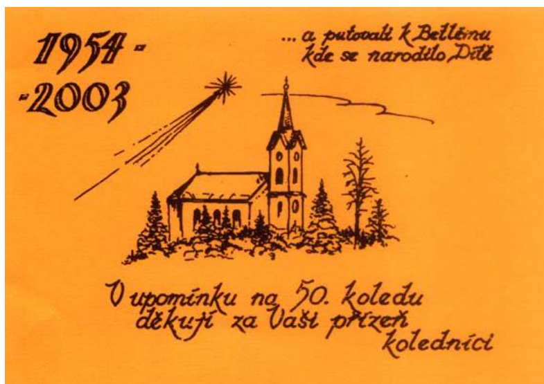
Upomínkový list k jubilejní 50. koledě vytvořil Václav Stránský.