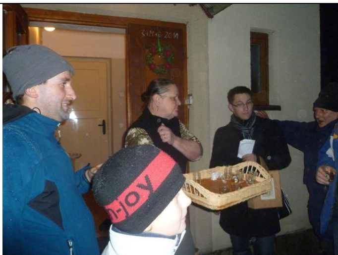
Průběh obchůzky (2011): poslední zastávka koledníků.