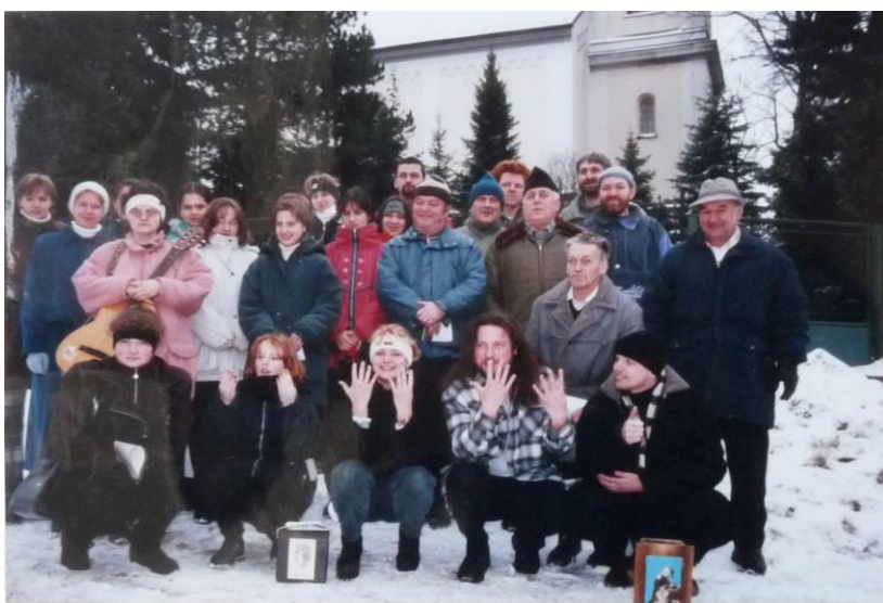
Skupinová fotografie účastníků koledy z roku 1998.