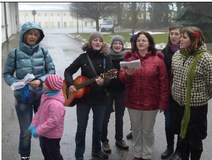
Průběh obchůzky (2011): jedna ze „štací“ kolednic.