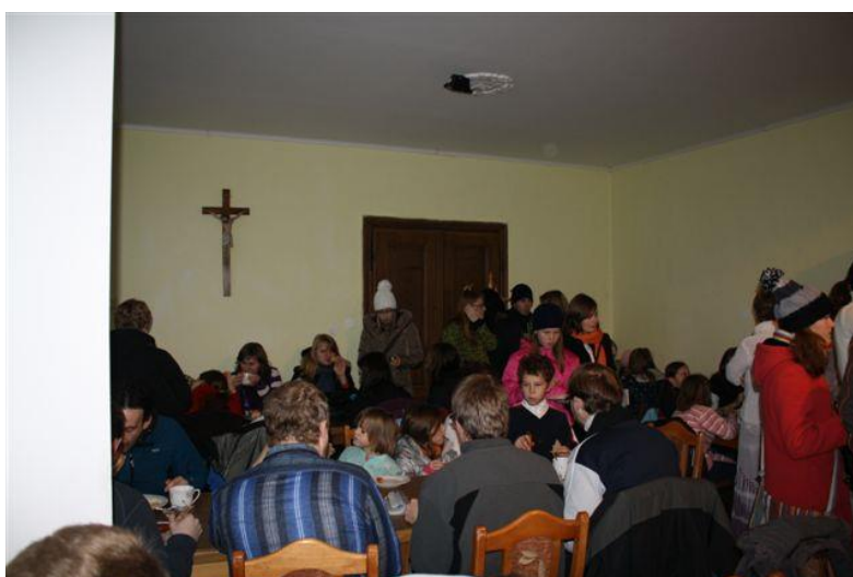
Průběh obchůzky (2011): snídaně koledníků na studenech faře.