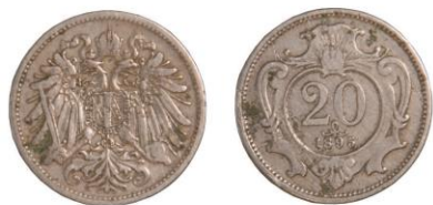
RAKOUSKO, František Josef I. (1848-1916), Vídeň, 20haléř 1895 - 1 ks