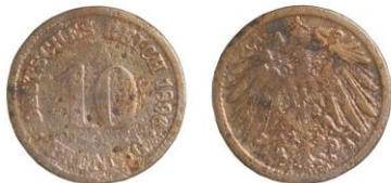
NĚMECKO, Vilém II. (1888–1918), Berlín, 10fenik 1896 - 1 ks