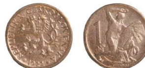
ČESKOSLOVENSKÁ REPUBLIKA, Kremnice, koruna - 1402 ks