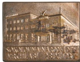
Odznak Sokolovna ve Vrchlabí, 1937