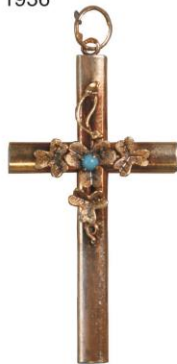
Křížek ze žlutého kovu s modrou aplikací