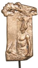
Odznak Čs. obce sokolské Na stráž, autor S. Sucharda