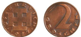
RAKOUSKO, Vídeň, 2groš 1927 - 1 ks