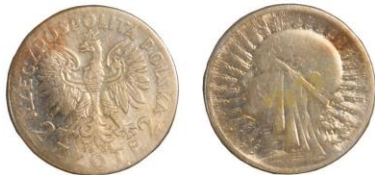
POLSKO, Varšava, 2 złote 1934 - 1 ks