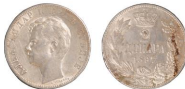
SRBSKO, Alexandr I. (1889–1902), bez zn. mincovny, 2dinar 1897 - 1 ks