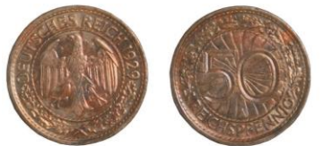
NĚMECKO, Berlín, 50 říšských feniků 1929 - 2 ks