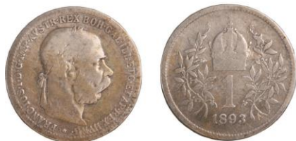
RAKOUSKO, František Josef I. (1848-1916), Vídeň, koruna 1893 - 1 ks