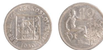
ČESKOSLOVENSKÁ REPUBLIKA, Kremnice, 10koruna - 11 ks