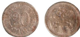
SRBSKO, Milan IV. Obrenovič (1868–1889), Birmingham, 20para 1884 - 2 ks SRBSKO, Peter I. (1903–1918), 20para 1912 - 2 ks