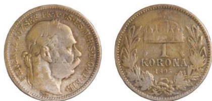
UHERSKO, František Josef I. (1848-1916), Kremnice, koruna 1895 - 1 ks