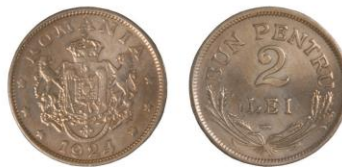
RUMUNSKO, Ferdinand I. (1914–1927), Poissy, 2lei 1924 - 1 ks