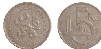
ČESKOSLOVENSKÁ REPUBLIKA, Kremnice, 5koruna - 210 ks