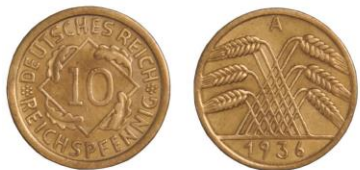
NĚMECKO, Berlín, 10 říšských feniků 1936 - 1 ks