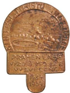
Odznak Klubu českých turistů Pramen Labe, 1934