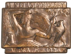
Odznak VIII. všesokolský slet v Praze, 1926