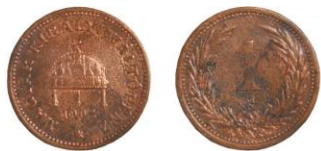
UHERSKO, František Josef I. (1848-1916), Kremnice, haléř (fillér) 1902 - 1 ks