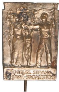
Odznak 40 let strany národně socialistické, autor K. Lhoták