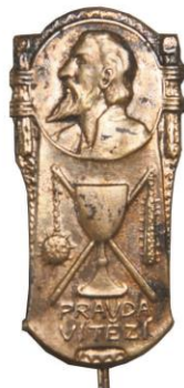
Odznak Jana Husi