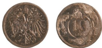
RAKOUSKO, František Josef I. (1848-1916), Vídeň, 10haléř 1895 - 1 ks