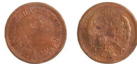
SRBSKO, Petr I. (1903–1918), bez zn. mincovny, 2para 1904 - 3 ks