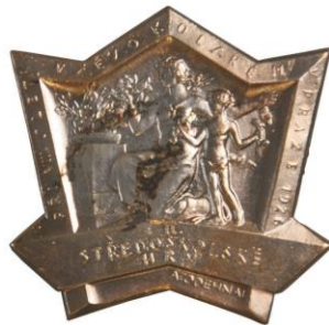
Odznak II. středoškolské hry v Praze, 1926, autor A. Odehnal