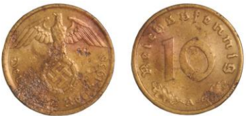
NĚMECKO, Berlín, 10 říšských feniků 1938 - 1 ks