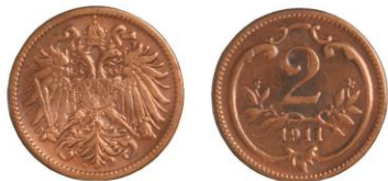
RAKOUSKO, František Josef I. (1848-1916), Vídeň, 2haléř 1911 - 1 ks